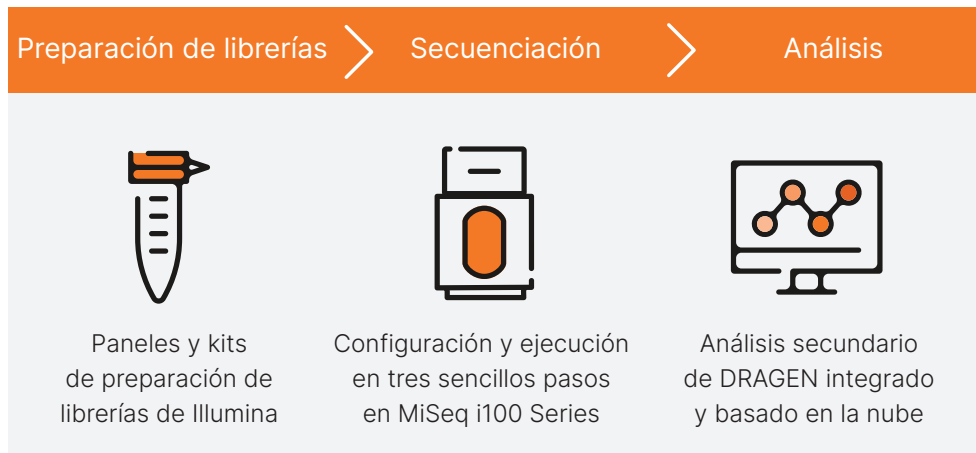
Figura 2: MiSeq i100 Sequencing System y MiSeq i100 Plus Sequencing System ofrecen un flujo de trabajo intuitivo y simplificado para facilitar la transición a la NGS.