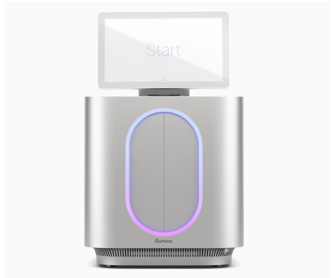
Figura 1: MiSeq i100 Sequencing System y MiSeq i100 Plus Sequencing System: la innovación de Illumina continúa ampliando el acceso a la NGS con sistemas de sobremesa diseñados para la simplicidad y la velocidad.

En Illumina, situamos la experiencia del cliente en el centro de cada innovación, facilitando todo lo posible la preparación de librerías, la secuenciación y el análisis de datos. Se han optimizado todos los aspectos del flujo de trabajo de MiSeq i100 Series para reducir al mínimo el tiempo y los recursos necesarios para realizar los proyectos (figura 2). MiSeq i100 System y MiSeq i100 Plus System ofrecen un flujo de trabajo simplificado con una configuración del experimento completa en solo tres pasos y en menos de 20 minutos.