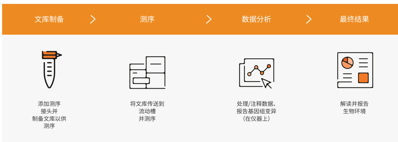
图 2: MiSeq 系统工作流程 — MiSeq 系统工作流程经过了简化，可为新一代桌上测序实现快速处理。可以使用任何兼容的文库制备试剂盒来制备文库。测序时间共五个半小时，包括在使用 MiSeq Control Software 的 MiSeq 系统上运行簇生成、测序、启用了双面扫描 (2 × 25 碱基对) 的评定质量分值碱基检出所花费的时间。

基于互联网的运行监控，以及一套安全、可扩展的存储解决方案。借助一整套数据分析工具以及数量不断增加的第三方分析应用程序，研究人员能够自行开展信息学研究。BaseSpace Sequence Hub 还可让您快速轻松地与同事或客户进行数据共享。