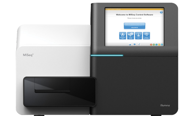
图 1: MiSeq 系统 — 外形小巧的 MiSeq 系统非常适合用于进行快速、具成本效益的新一代测序。

MiSeq 系统提供了首个 DNA 到数据测序平台，将簇生成测序和数据分析功能整合到一台仪器中。该系统占地面积小，只需约两平方英尺，很容易安置于几乎任何实验室环境中（图 1）。MiSeq 系统利用 Illumina 的边合成边测序 (SBS) 化学技术，这是一项成熟的新一代测序 (NGS) 技术，已被 30 多万篇同行评审的出版物引为参考，是所有其他 NGS 技术总和的 5 倍。 1 MiSeq 系统外形小巧却具有强大的 NGS 功能，是以经济实惠的方式快速进行基因分析的理想平台。