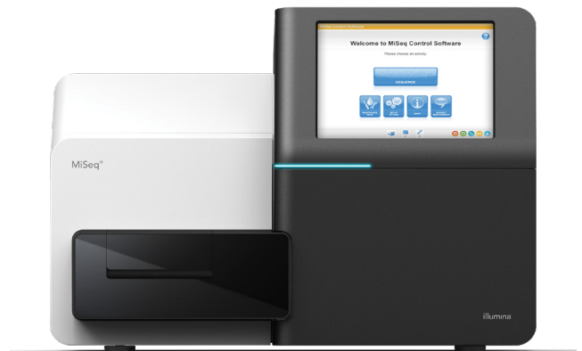
Figura 1: MiSeq System. MiSeq System es un instrumento compacto idóneo para la secuenciación de nueva generación rápida y rentable.

MiSeq System ofrece la primera plataforma de secuenciación de ADN a datos que integra la generación de grupos, la amplificación, la secuenciación y el análisis de datos en un único instrumento. Por sus pequeñas dimensiones (aproximadamente unos 0,19 m 2 ) encaja en prácticamente cualquier entorno de laboratorio (figura 1). MiSeq System aprovecha la química de secuenciación por síntesis (SBS, sequencing by synthesis) de Illumina, una tecnología de secuenciación de nueva generación (NGS, next-generation sequencing) probada citada en más de 300 000 publicaciones revisadas por expertos, lo que supone una cifra 5 veces superior que el resto de las tecnologías de NGS combinadas. 1 Con la potencia de la NGS proporcionada en un formato compacto, MiSeq System es la plataforma ideal para un análisis genómico rápido y rentable.