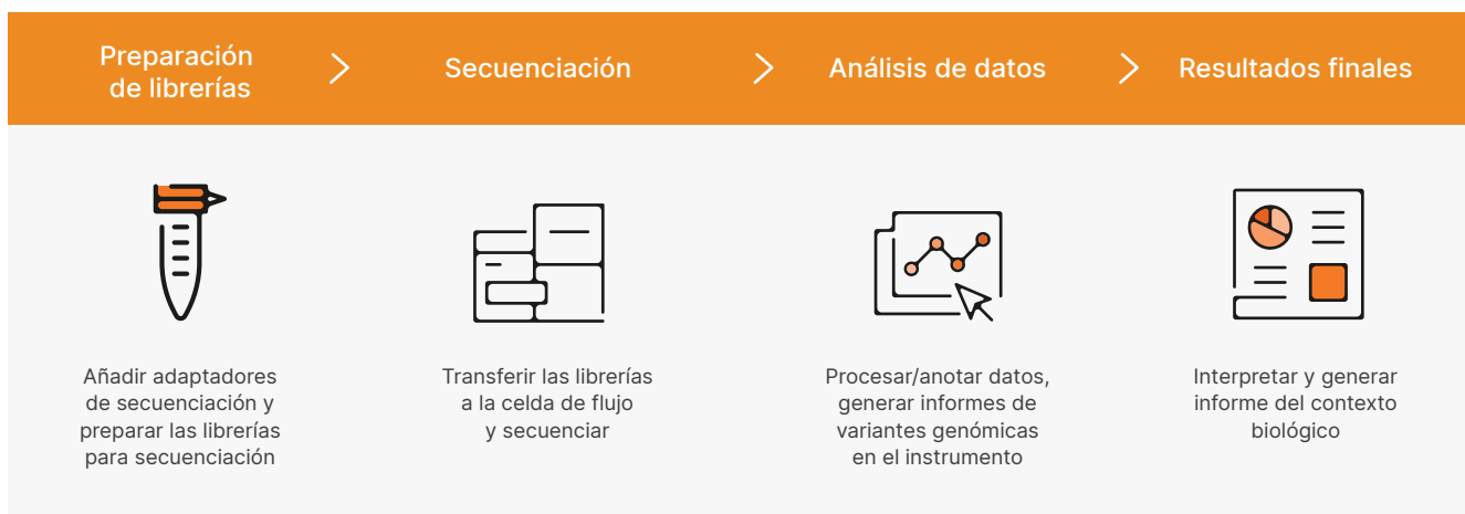
Figura 2: Flujo de trabajo de MiSeq System. El flujo de trabajo optimizado de MiSeq System permite un tiempo de procesamiento rápido para la secuenciación de nueva generación de sobremesa. Las librerías se pueden preparar con cualquier kit de preparación de librerías compatible. El tiempo de secuenciación de cinco horas y media incluye la generación de grupos, la secuenciación y la llamada de bases con puntuación de calidad con adquisición de imágenes de las dos superficies para cada experimento de 2 x 25 pares de bases en MiSeq System con MiSeq Control Software.

datos integrado y acceso a BaseSpace™ Sequence Hub, la plataforma informática basada en la nube para genómica de Illumina. BaseSpace Sequence Hub proporciona carga de datos en tiempo real, herramientas sencillas de análisis de datos, supervisión de experimentos a través de Internet, además de una solución de almacenamiento segura y flexible. Un paquete de herramientas de análisis de datos y una lista cada vez más extensa de aplicaciones de análisis de terceros facilitan los procesos informáticos de los investigadores. BaseSpace Sequence Hub también permite compartir datos con compañeros o clientes de manera fácil y rápida.