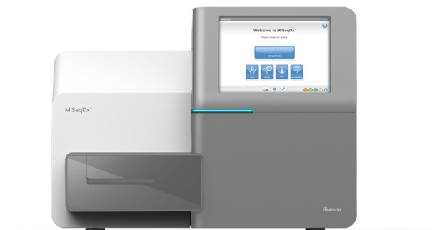
Abbildung 1: MiSeqDx Instrument: Das FDA-konforme MiSeqDx Instrument mit CE-Kennzeichnung für IVD bietet einen einfachen Workflow, eine leicht zu bedienende Software-Benutzeroberfläche und modernste Benutzersicherheitsfunktionen.

Das MiSeqDx Instrument ist die erste von der Food and Drug Administration (FDA) zugelassene Plattform zur In-vitro -Diagnostik für NGS (Next-Generation Sequencing, Sequenzierung der nächsten Generation) mit CE-Kennzeichnung (Conformité Européenne) (Abbildung 1). Das speziell für die klinische Laborumgebung entwickelte kompakte MiSeqDx Instrument benötigt nur wenig Platz (0,3 Quadratmeter) und bietet einen benutzerfreundlichen Workflow sowie eine auf die verschiedenen Anforderungen klinischer Labore abgestimmte Datenausgabe. Darüber hinaus bietet die im Gerät integrierte Software Optionen für die Laufkonfiguration, Probenverfolgung und Benutzerverwaltung sowie für Prüfpfade und die Ergebnisinterpretation.* Zusammen mit der bewährten SBS-Chemie (Sequencing by Synthesis, Sequenzierung durch Synthese) von Illumina ermöglicht das MiSeqDx Instrument genaue und zuverlässige Screenings und Diagnostesttests.