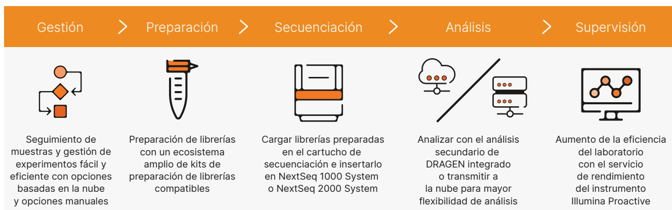
Figura 2: Flujo de trabajo intuitivo desde la librería hasta el análisis. NextSeq 1000 System y NextSeq 2000 System proporcionan un flujo de trabajo exhaustivo que incluye la configuración sencilla de los experimentos, el ecosistema más amplio de kits de preparación de librerías compatibles, la operación de carga y descarga y el análisis secundario integrado en el instrumento.