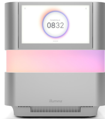
Figura 1: NextSeq 2000 Sequencing System. NextSeq 2000 System ofrece características de diseño innovadoras, una química avanzada, una bioinformática simplificada y un flujo de trabajo intuitivo que posibilita la más amplia gama de aplicaciones y versatilidad para los sistemas de secuenciación de sobremesa.

NextSeq 1000 System y NextSeq 2000 System se basan en la química XLEAP-SBS, una química SBS más rápida, de mayor calidad y más sólida, fundamentada en la química de SBS estándar probada de Illumina. Los nucleótidos de XLEAP-SBS emplean colorantes de última generación y conectores y bloques novedosos que son más resistentes al calor, muestran una reducción 50 veces mayor en la hidrólisis y una escisión del bloque 2,5 veces más rápida para reducir la fase de hebra retrasada y la fase de hebra adelantada. La polimerasa de XLEAP-SBS está diseñada para incorporar nucleótidos más rápido y con mayor fidelidad