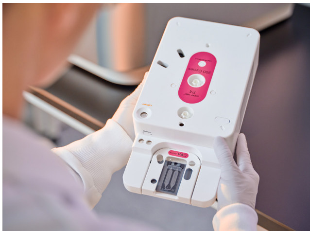
Figura 4: Cartucho de reactivos NextSeq 1000 y NextSeq 2000. El cartucho integrado incluye reactivos, flúidica y el soporte de residuos. Solo tiene que descongelar y preparar el cartucho de reactivos, insertar la celda de flujo, cargar la librería y colocarla en el instrumento.

Los reactivos se mantienen siempre dentro del cartucho, obteniéndose un diseño sin líquido del instrumento que no necesita lavarse. Esto se traduce en un mantenimiento optimizado y en una eficacia mejorada del mismo.